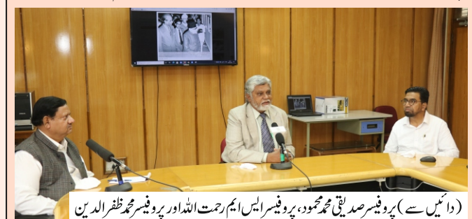
الكلام - مولانا آزاد نيشنل أُردو يونيورستى ميگزين - اپريل 2021 شماره XXIX 12

یو نیور سٹی و یب سائٹ manu.edu.in پر پر و فیسر ایس ایم رحمت اللہ، وائس چانسلر انچارج کے ہاتھوں 28 راگست 2020 کو مولا نا ابوال کلام آزادور چول ( آن لائن) میوزیم کا افتتاح عمل میں آیا۔میوزیم میں مولا نا آزاد کی نادر تصاویر، ان کی تحریر و تقاریرا ورو ٹی یوز موجود بیں۔اور وقت کے ساتھ ساتھ اس میں اضافہ کیا جائے گا۔اس موقع پر خطاب کرتے ہوئے پر و فیسر رحمت اللہ نے مولا نا آزاد کے افکارو خیالات اور قومی و ملی خدمات پر روشن ڈالی۔ورچول میوزیم کے بارے میں انصوں نے کہا کہ یو نیور سی کے قیام کے بعد سے واکس چانسلرس اور دیگر ارا کین نے مولا نا آزاد کی نادر تصاویر، تحریریں، تقاریر جنع کی بیں جو ورچول میوزیم میں آن لائن فراہم کیا جائے گا وار اس میں بتدری مخفوظ ہیں۔انہیں اب ورچول میوزیم میں آن لائن فراہم کیا جائے گا وار اس میں بتدری مخفوظ ہیں۔انہیں اب سے معلومات کے حصول کے خواہ شمندوں اور محفقوں کو فائدہ ہوگا۔ پر وفیسر صدیق کی محمود، رجہ ارار نچارتی نے کہا کہ مولا نا آزاد کی اور تک مولا نا آزاد پر ایک متند ذخیرہ ہوگا جس سے معلومات کے حصول کے خواہ شمندوں اور محفقوں کو فائدہ ہوگا۔ پر وفیسر صدیق محمود، پر و فیسر محد الہ ہیں رہنا ہوں رہوں نے کا اس مرح محمد کا ہے ہو کہ جس