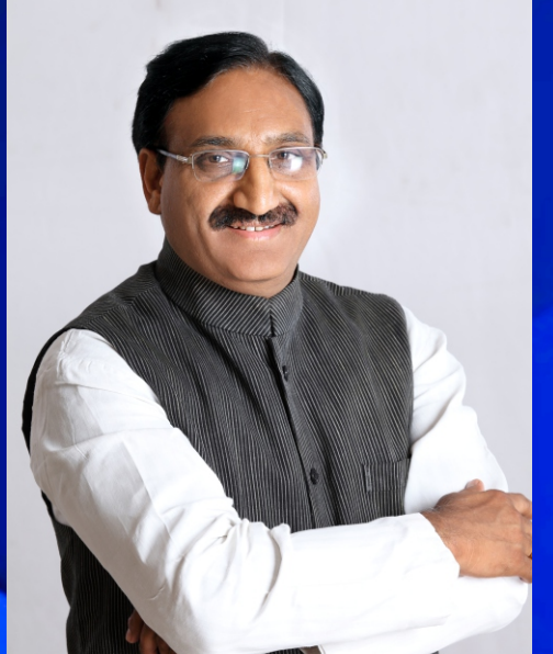
Hon'ble Education Minister of India Dr. Ramesh Pokhrival 'Nishank'