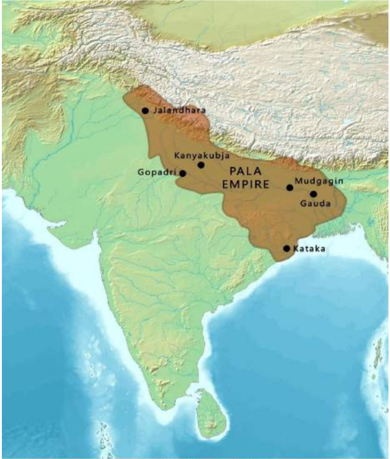
تصویر 3.2۔ پال ریاست اپنے انتہائی عروج پر تقریباً نویں صدی https://en.wikipedia.org/wiki/Pala_Empire#/media/File:Map_of_the_Pala_Empire.png

راجدھانی منگیر کی طرف بڑھا۔ ادھر دھرم پال بھی اپنا لشکر لے کر مقابلے کے لیے تیار تھا۔ منگیر کے قریب دونوں میں ایک گھمسان جنگ ہوئی جس میں دھرم پال نے شکست کھائی۔ مجبور ہو کر دھرم پال کو راشٹر کوٹ حکمران گووند سوم سے مدد طلب کرنا پڑی۔ گووند سوم نے شمالی ہند کے لیے کوچ کیا اور حملہ کر کے ناگ بھٹ دوم کو شکست دی۔ راشٹر کوٹ دستاویزوں سے پتہ چلتا ہے کہ چکرایدھ اور دھرم پال دونوں نے