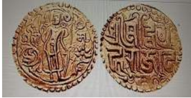
چوہان حکمران وگرہ راج چہارم کاسکھ

موجود تھیں۔ دشرتھ شرما کے خیال کے مطابق نئی ذاتوں کی بنیاد صوبائی حدود، صنعتیں اور پیشے تھے۔ پیشوں کی بنیاد پر اس دور میں کاسٹوں جیسی نئی ذاتیں وجود میں آئی تھیں جن کے معنی مصنفین یا منشی تھے۔