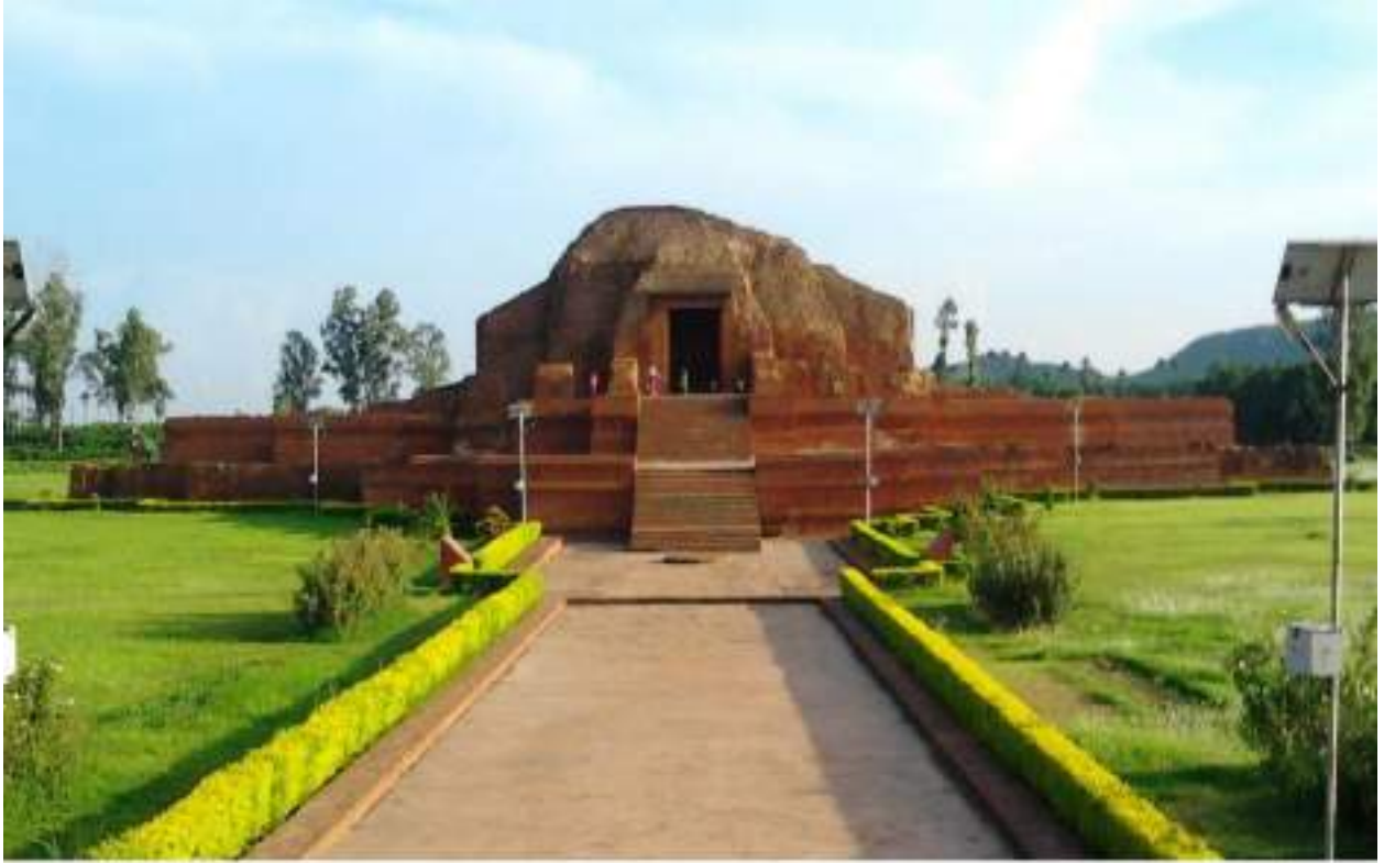
تصویر 1۔3۔ وکرم شلا کے ماخذ کے بقاات ماتحتی چک، بھاگل پور ضلع، بہار

ماتحتی میں قنوج کا حکمراں بنایا اور اس طرح اپنے اقتدار اعلیٰ کا اعلان کیا۔ دھرم پال کے ذریعے منعقد کردہ اس دربار میں کئی ماتحت جاگیر دار حکمراں شامل ہوئے۔ دھرم پال کی حکمرانی کا بنیادی علاقہ بنگال اور بہار تھا۔ یہ علاقے براہ راست اس کی عملداری میں تھا۔ اس کے باہر قنوج کی ریاست اس کے زیر اثر تھی۔ علاوہ ازیں مغرب اور جنوب میں پنجاب کے حکمراں، مغربی پہاڑی علاقوں کے سردار، راجپوتانہ، مالوہ اور برار نے اس کے اقتدار کو تسلیم کیا۔ اس کے علاوہ بھی شمالی ہند کی متعدد چھوٹی چھوٹی ریاستوں نے اس کی برتری کا اعتراف کیا۔ سوینجھوپران (Suvayanbhu Purana) میں دی گئی تفصیلات کے مطابق نیپال بھی اس کی ایک ماتحت ریاست تھی۔ یہ کوئی اتفاق نہیں ہے کہ گیارہویں صدی کے ایک گجراتی شاعر 'سوڈ ڈھل' نے دھرم پال کو 'اتراپتھ سوامن' کہا ہے۔ اگر تبت کے ماخذ کو تسلیم کریں تو وکرم شلا کے