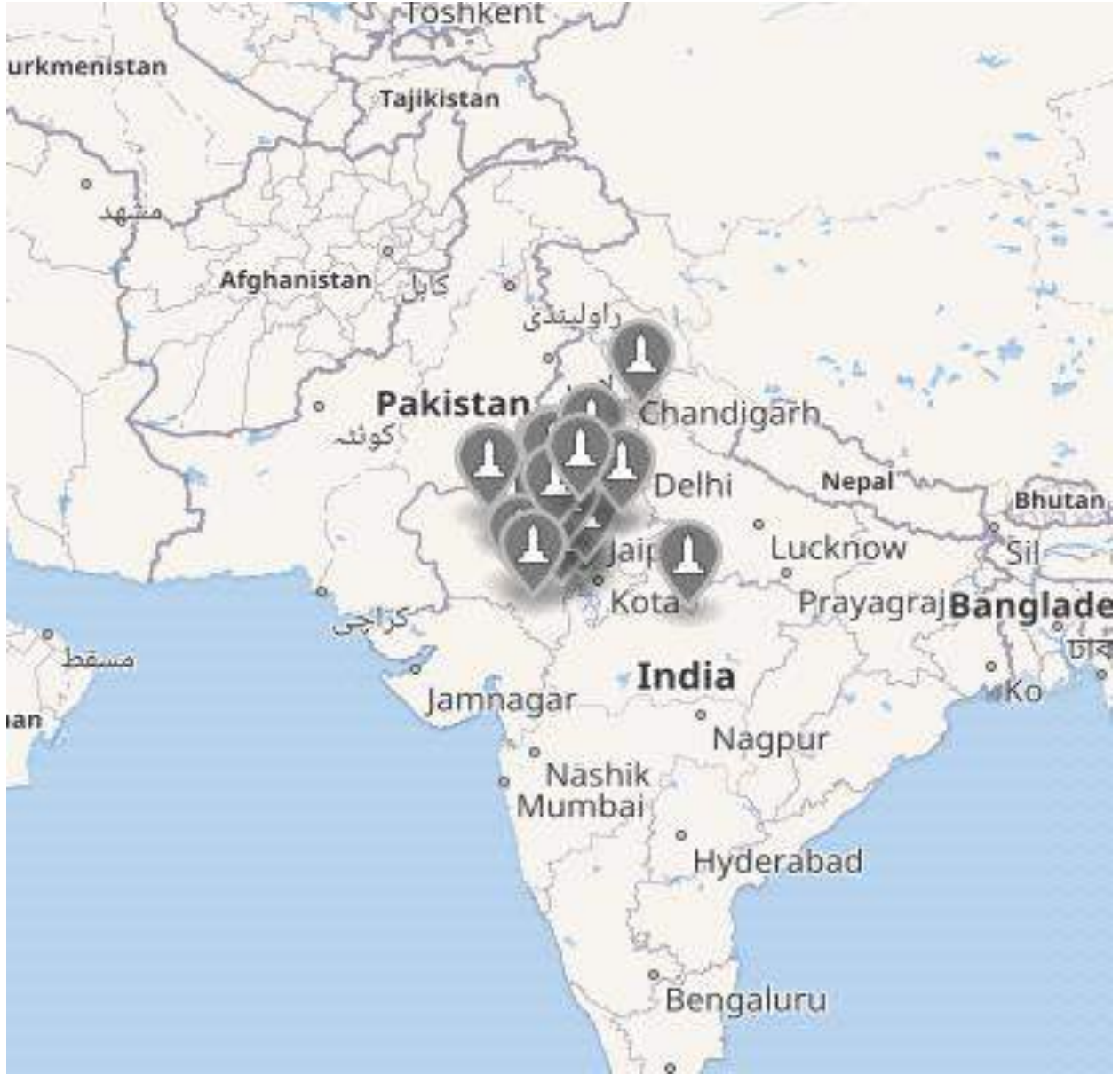
تصویر 6.1۔ شاکمبھری چوہان کے دور حکومت میں جاری کتبات کے مقامات

راجستھان میں شاکمبھری (سانجھ کے قریب مشرق میں) میں واقع ہے۔ ہر شکتی سے پتہ چلتا ہے کہ اننت (بے پور، راجستھان میں سیکر کے قریب) چوہانوں کی قدیم راجدھانی تھا۔ یہیں تنزپال اور سمپال نے وگرہ راج دوم کے دادا اداکپتی راج پر حملہ کرنے کی کوشش کی تھی اور یہیں چوہانوں کے خاندانی دیوتا ہرش کا مندر تھا۔ بھولیا کتبہ سمت کو اننت سامنت لکھتا ہے جس کی روشنی میں صرف یہ مطلب لیا جاسکتا ہے کہ وہ اننت کا سامنت یا حکمراں تھا۔ بھولیا کتبے میں اس کی جڑیں اہمچھتر پورہ میں ہونے کا ذکر بھی کیا گیا ہے جو راجدھانی اننت گوچر (موجودہ ہر شاگیری کے قریب) سے میل نہیں کھاتا۔ مزید برآں پر تھوی راج و بے، ہمیرا مہا کاویہ اور سر جناچریت، راجستھان کے پشکر کو چوہان خاندان کی جائے پیدائش بتاتے ہیں۔