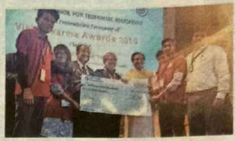
కేంద్ర మంత్రి నుంచి అవార్డు అందుకుంటున్న విద్యార్థులు

గచ్చిబౌలి న్యూస్టుడే: గచ్చిబౌలిలోని మౌలానా ఆజాద్ నేషనల్ ఉర్దూ యూనివర్సిటీ(మనూ) పాలిటెక్నిక్ విద్యార్థుల బృందం ప్రతిష్టాత్మకమైన ఛాత్ర విశ్వకర్మ అవార్డు 2019 అందుకుంది. ఆలిండియా కౌన్సిల్ ఫర్ టెక్నికల్ ఎడ్యుకేషన్(ఏఐసీటీఈ) ఇటీవల నిర్వహించిన జాతీయ