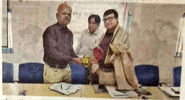
and practice are the basic prerequisites, he added. The students presented

The former HOD further said that reading is essential for learning how to write. Students must study the well-known writers of the genre in which they want to write. To become a successful writer or poet, in depth study