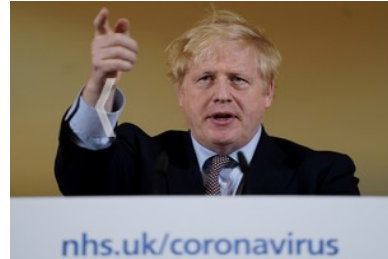
LONDON, March 17 (Xinhua) -- British Prime Minister Boris Johnson speaks at a press conference inside 10 Downing Street in London, Britain, on March 16, 2020. British