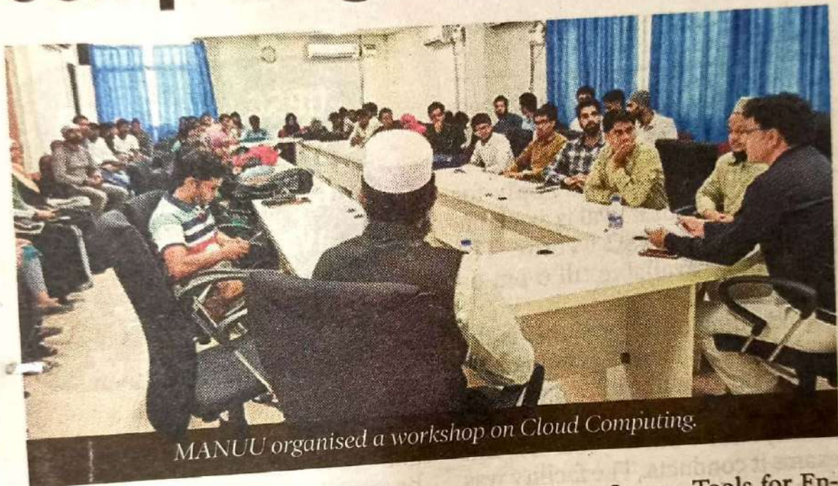
MANUU organised a workshop on Cloud Computing.