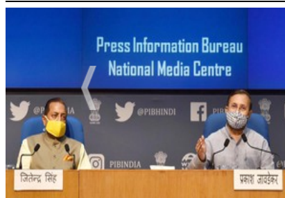
NEW DELHI, AUG 19 (UNI):- Union Minister for Environment, Forest & Climate Change, Information & Broadcasting and Heavy Industries and Public Enterprise. Prakash