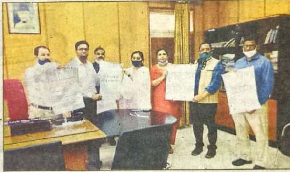
मौलाना आज़ाद नेशनल उर्दू यूनिवर्सिटी, हैदराबाद में आयोजित हिन्दी सप्ताह का दृश्य।