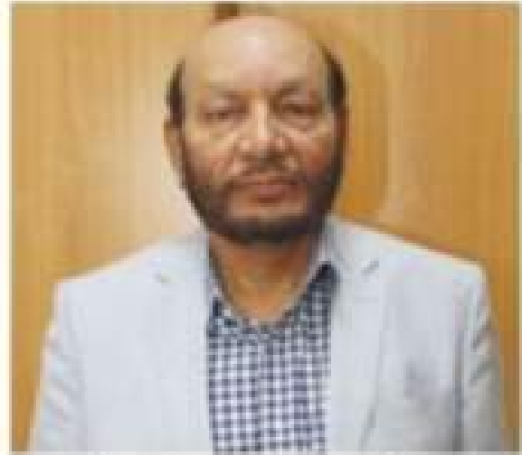
سری نگر 22 ستمبر (یو این آئی)

قومی اردو سائنس کانگریس کے ماشے پر یو این آئی اردو کو دیے گئے ایک انٹرویو کے دوران کہا ہے۔ انہوں نے کہا: 'یونیورسٹی کے وائس چانسلر کا عہدہ سنجھانے کے روز اول سے ہی میں نے کیمپس کے بارے میں سوچنا شروع کیا اور یہاں اس کانگریس میں شرکت بھی اسی سلسلے کی ایک کڑی ہے۔ پروفیسر عین احسن نے کہا کہ یہاں ہدکام کے پائواڈ میں کیمپس کی تعمیر کا کام بہت جلد شروع کرنے کی کوشش کی جائے گی۔