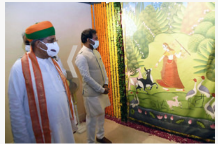
NEW DELHI, SEP 07 (UNI):- Union Minister for Culture, Tourism and Development of North Eastern Region (DoNER), G. Kishan Reddy visiting an exhibition on Gita Govinda