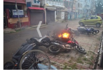
AGARTALA, SEP 8 (UNI):- Visuals after the alleged clash between BJP and CPI(M) in Agartala on Wednesday.