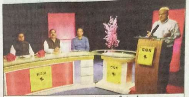
मौलाना आजाद नेशनल उर्दू यूनिवर्सिटी, हैदराबाद द्वारा आयोजित आजादी का अमृत महोत्सव के अंतर्गत दांडी यात्रा विषय पर व्याख्यान संपन्न हुआ।