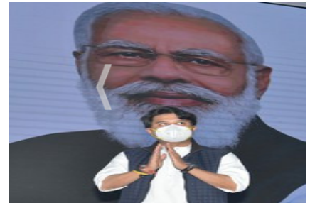
NEW DELHI, NOV 11 (UNI):- Civil Aviation Minister Jyotiraditya Scindia during the launch of e-service platform of DGCA namely eGCA, in New Delhi on Thursday.