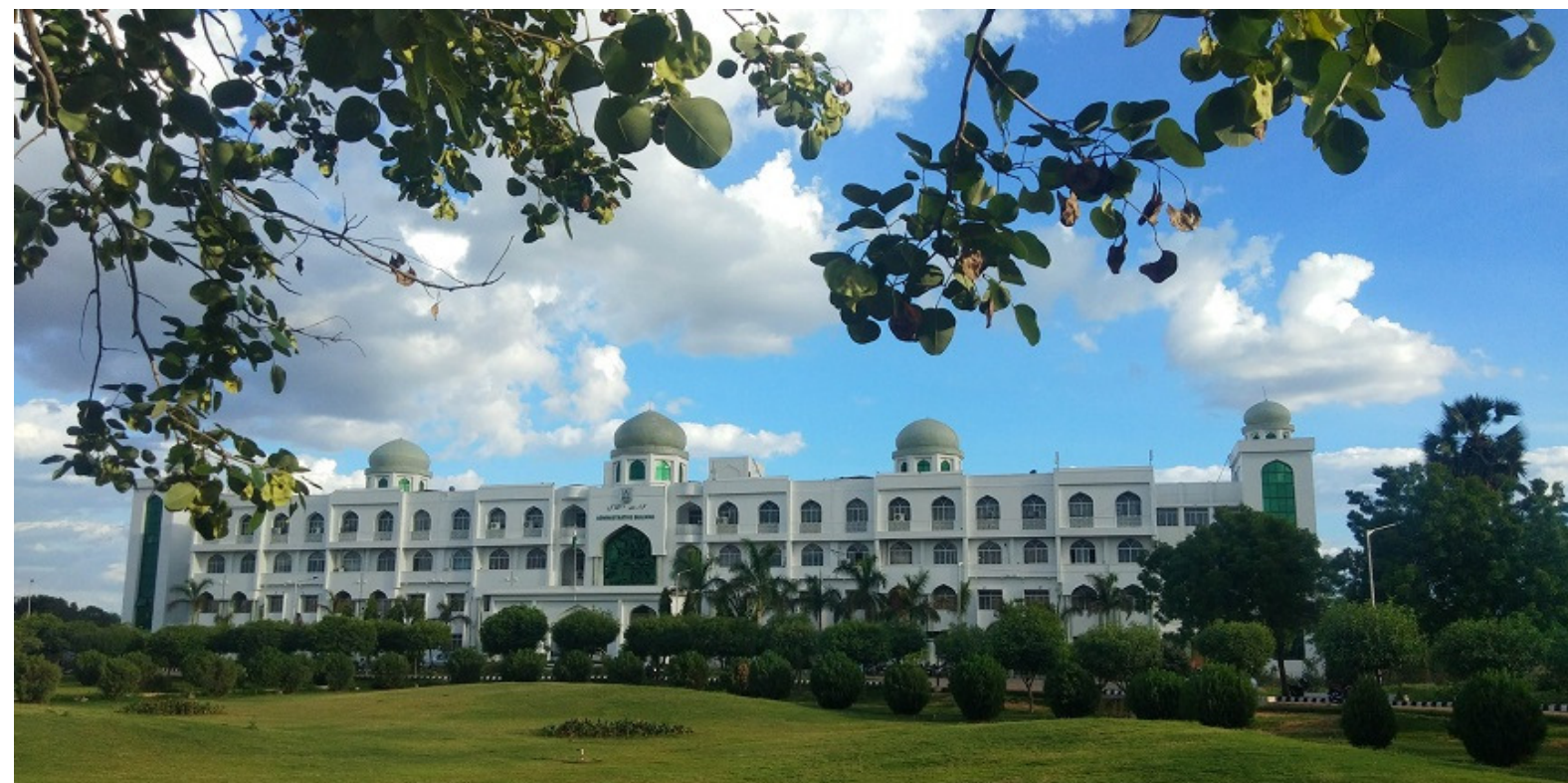
Maulana Azad National Urdu University

Maulana Azad National Urdu University launched a digital initiative on the eve of National Education Day as a tribute to Maulana Abul Kalam Azad.