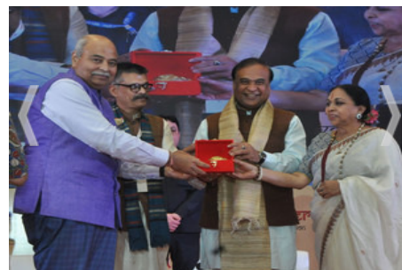
NEW DELHI, MAY 22 (UNI):- Assam Chief Minister Himanta Biswa Sarma during the Mahamanthan conclave organised by Panchjanya Magazine in New Delhi on Sunday