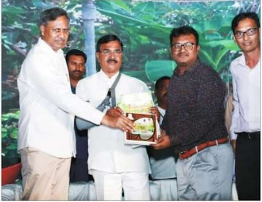
باغات کے زمرہ میں پیلا انعام حاصل ہوا۔ تلنگانہ کے وزیر زراعت و پاغبانی جناب ایس نرقجن ریڈی نے 15 م اپریل کو باغ عامہ، حیدرآباد میں منعقدہ ایک تقریب میں

زمرو میں فیسٹول میں حصہ لیا تھا۔ اس سلسلے میں تحکمہ کی ایک ٹیم نے 23 رجنوری 2023 کواردویو نیورش کا دورہ کرتے ہوئے پیمال موجود یاغات، شجر کاری، سرسیزی کا معائنہ کیا تھا۔