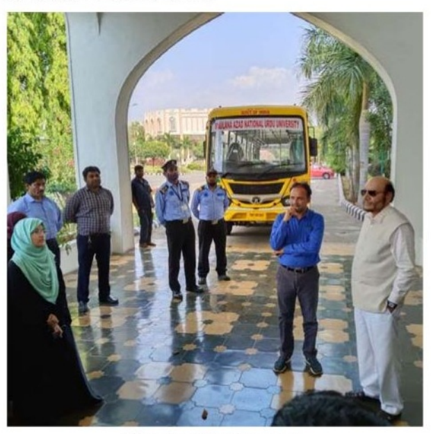
(Standard Post Bureau)

Hyderabad, March 31: Maulana Azad National Urdu University (MANUU) purchased a new fifty seater bus and an ambulance with latest medical equipment for the benefit of students and other stakeholders.