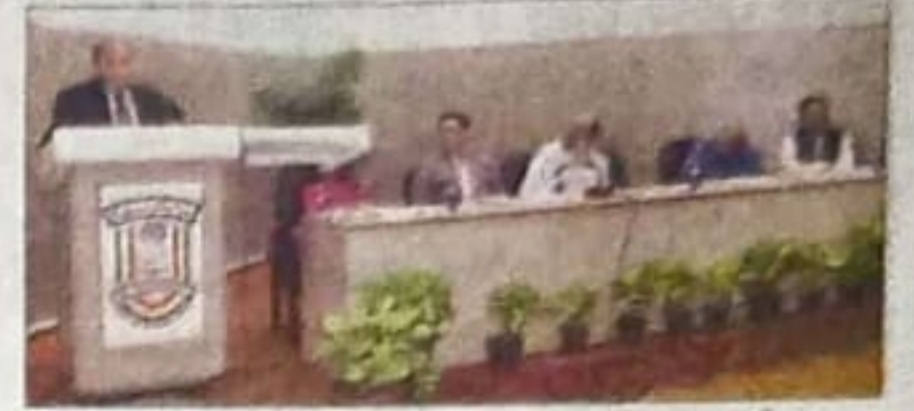
మాట్లాడుతున్న ఉస్మానియా యూనివర్సిటీ మాజీ వీసీ ప్రొఫెసర్ సులేమాన్ సిద్దిఖీ

ఉస్మానియా యూనివర్సిటీ మాజీ వీసీ సులేమాన్ సిద్దిఖీ