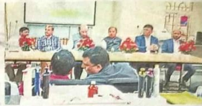
సదస్సులో పాల్గొన్న అతిథులు