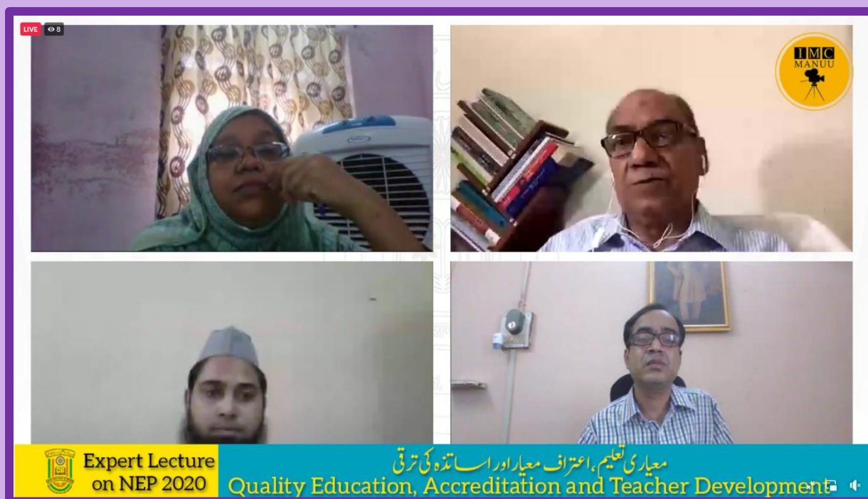
Fig 5: Inaugural Session