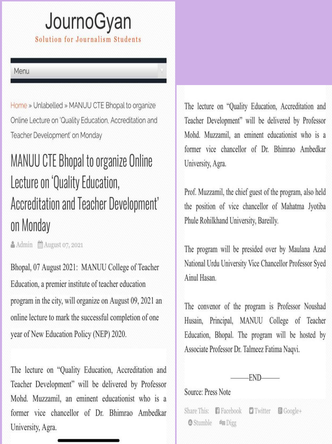
Fig 4: Media Coverage before the Programme

The news for the Online Expert Lecture has been spread through various electronic and print media so that maximum number of stakeholders may be benefited: