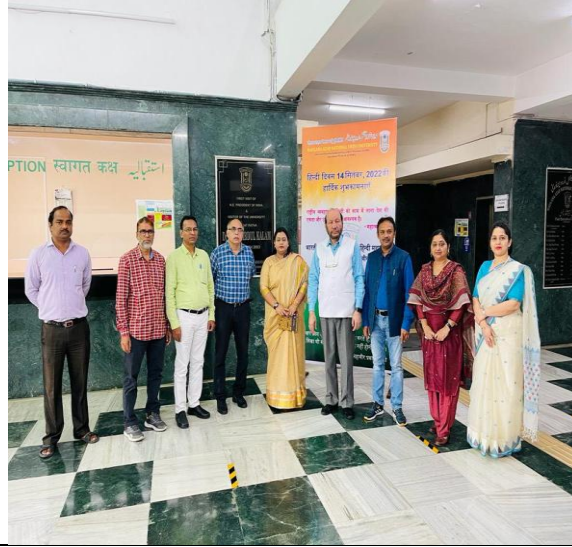
माननीय कुलपति एवं कुलसचिव महोदय से भेंट के दौरान राजभाषा कार्यान्वयन समिति के सदस्य ।