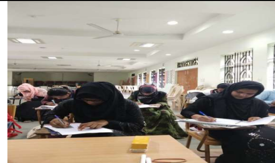
हिन्दी निबंध प्रतियोगिता