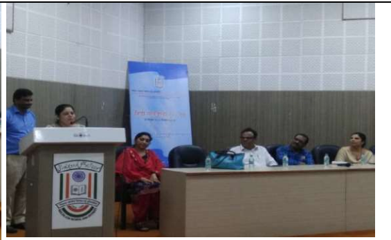
हिन्दी पखवाड़ा समापन समारोह