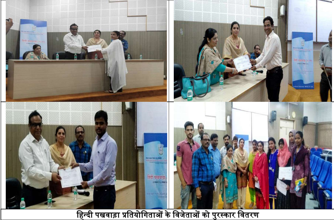
हिन्दी पखवाड़ा प्रतियोगिताओं के विजेताओं को पुरस्कार वितरण