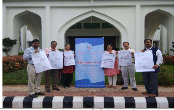
राजभाषा कार्यान्वयन समिति के सदस्यों द्वारा राजभाषा हिन्दी का प्रचार