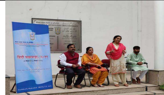
हिन्दी की उन्नति के लिए व्याख्यान का आयोजन