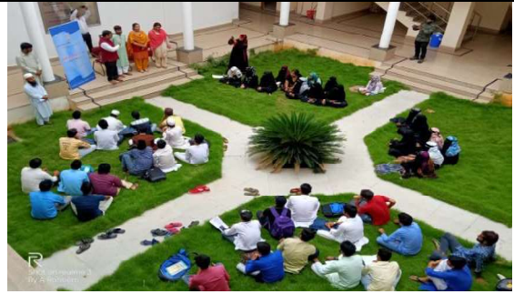
हिन्दी स्लोगन प्रतियोगिता