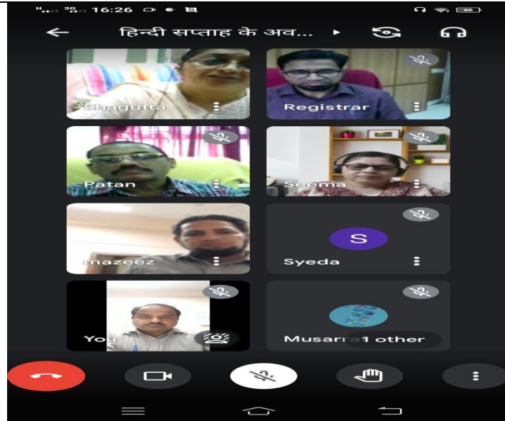
हिन्दी सप्ताह समापन समारोह (ऑनलाइन)