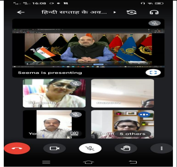
हिन्दी दिवस के उपलक्ष्य में माननीय गृह मंत्री अमित शाह का संदेश