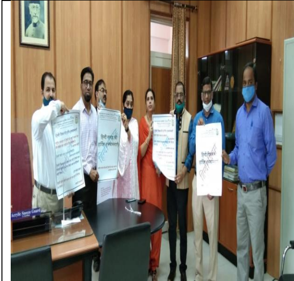
कुलसचिव द्वारा हिन्दी दिवस पोस्टर का लोकार्पण

हिन्दी सप्ताह का समापन हिन्दी अधिकारी द्वारा सभी प्रतिभागियों के प्रति आभार व्यक्त करते हुए किया गया।